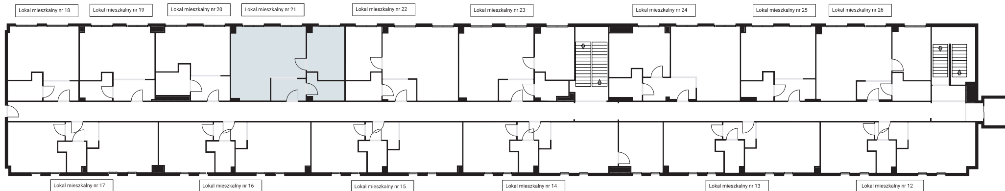
Lokal mieszkalny nr 18