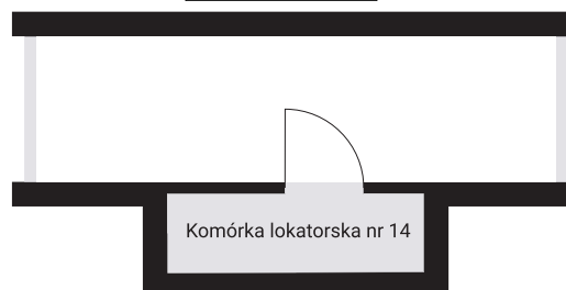
Komórka lokatorska nr 14